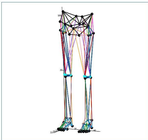
Рисунок. 3. Схематичне зображення інтерпретаційної фізико-математичної моделі нижньої частини опорно-рухового апарату людини.

В процесі побудови планується застосовувати інструментальну базу дискретного геометричного формоутворення, необхідно зазначити, що кістки будуть інтерпретуватимуться, як жорсткі стрижні, що працюють в межах пружних деформацій без втрати стійкості, а м'язи – як гнучкі нерозтяжні ланки, які після зникнення зусиль, що зумовлюватимуть розтягнення та будуть намагатися повернутися у початковий стан [1]. На початковому етапі дослідження фізико-інтерпретаційна модель виглядає наступним чином, рис. 3 та рис. 4.