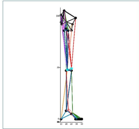
Рисунок. 4. Схематичне зображення інтерпретаційної фізико-математичної моделі нижньої частини опорно-рухового апарату людини (вигляд збоку).

Варто відзначити, що моделювання характеру роботи дозволяє визначити величини опорних реакцій модельованих конструкцій та впливати на перерозподіл цих реакцій з метою розвантаження окремих опор [2].